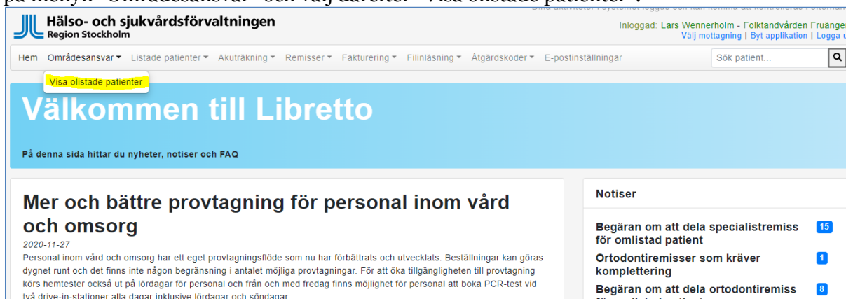
Figur 2: Visa olistade patienter

För att se vilka olistade patienter som för närvarande finns inom ditt områdesansvar, klicka på menyn ”Områdesansvar” och välj därefter ”Visa olistade patienter”: